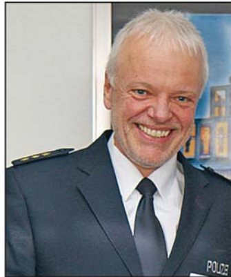
UWG-Chef Schnadt setzte sich für die Bürger ein.

D ass das Ordnungsamt der Stadt Balve Bürger in Volkringhausen abkassierte, weil sie nach Meinung des Bürgermeisters verkehrswidrig geparkt haben, hat den UWG-Fraktions-Vorsitzenden auf den Plan gerufen. Er half dem Stadtoberhaupt mit dem Wissen eines Polizeidirektors auf die Sprünge, und zwar so schnell, dass die Stadt Balve auf die Zahlung des Bußgeldes verzichtete.