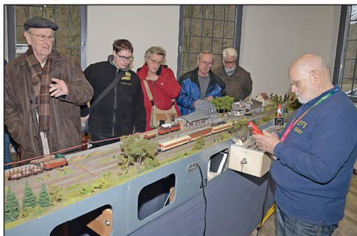
Das Kolpingforum ist am 5. Februar in Binolen.

„Die bis ins Detail liebevoll mit viel Mühe in Eigenarbeit angefertigten Module