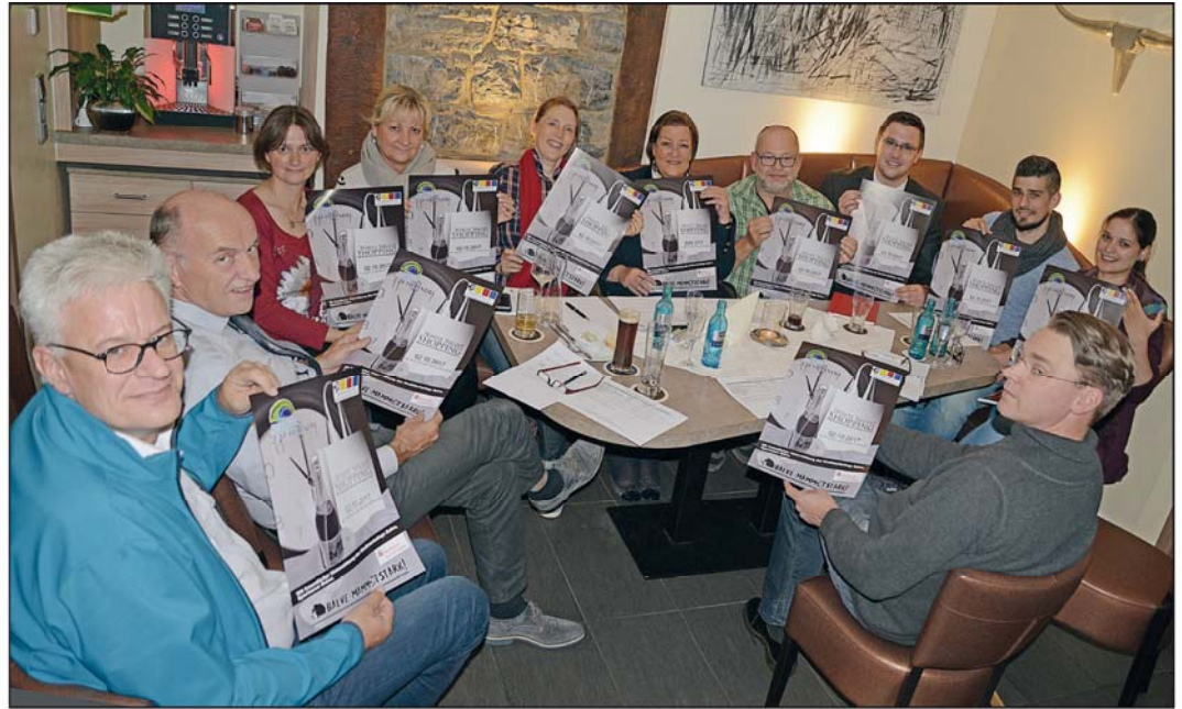
In der Mitgliederversammlung am 8. November lassen die Fachhändler die Oktober-Veranstaltung White-Night-Shopping Revue passieren.

Der Balver Weihnachtsmarkt stand in den letzten Jahren unter dem Stern des Wandels. Die Attraktivität der Veranstaltung soll abermals gesteigert werden. Dabei heißt das Credo der veranstaltenden Gemeinschaft Balver Fachhändler auch in diesem Jahr: Klein und ge-