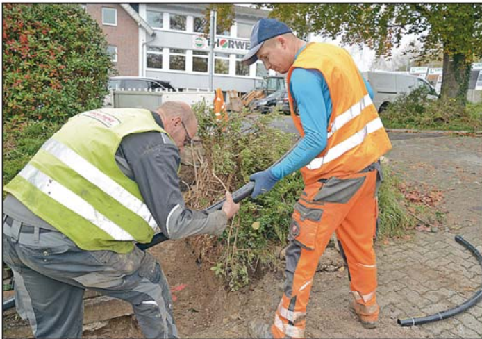
Vor dem Bahnhof Balve liegen die Glasfaserkabel bereits in der Erde.